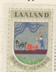
Laalands Nørre Herred

Branderslev, Sandby, Købelev, Vindeby, Utterslev, Horslunde, Nørdlunde, Herredskirke, Løjtofte, Halsted, Vesterborg, Birket.